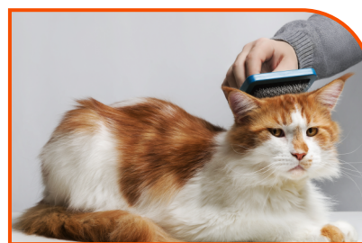
Desembaraçador de Pelos