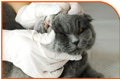
Gel Transdérmico Veterinário