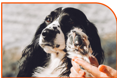
Creme para patas