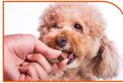
Pasta Oral Veterinária