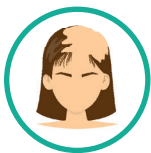
Alopecia Androgenética masculina e feminina

A linha VPK Farma de BIO•FATORES conta com fatores de crescimento sintetizados diretamente em sua forma bioativa, que além de possuírem alta biodisponibilidade e estabilidade, ainda fornecem uma penetração cutânea otimizada, sendo especialmente indicados para o tratamento das desordens cutâneas e capilares, como: